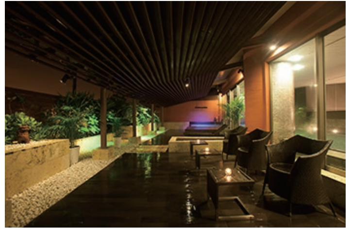
CHURASPA のトリートメントを受けられたお客様は、ロワジール スパタワー 那覇の [三重城温泉 海人の湯] を無料でご利用いただけます。