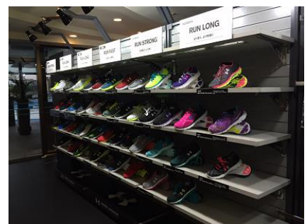
最新ランニングギア(イメージ)