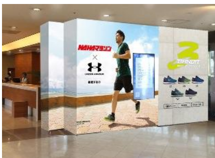
ロワジュールホテル 那覇 1F ロビーエントランス (イメージ)

ロワジュールホテル 那覇では、これからも沖縄県を訪れる方々に、スポーツを通じて有効な情報とサービスを提供していく予定です。