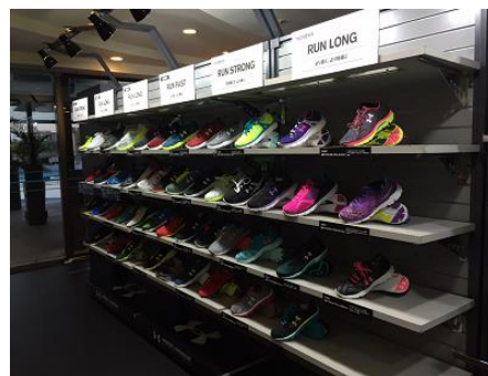
最新ランニングギア (イメージ)