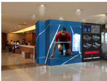
ロワジールホテル 那覇 エントランス (イメージ)

ロワジールホテル 那覇では、これからも沖縄県を訪れる方々に、スポーツを通じて有効な情報とサービスを提供していく予定です。